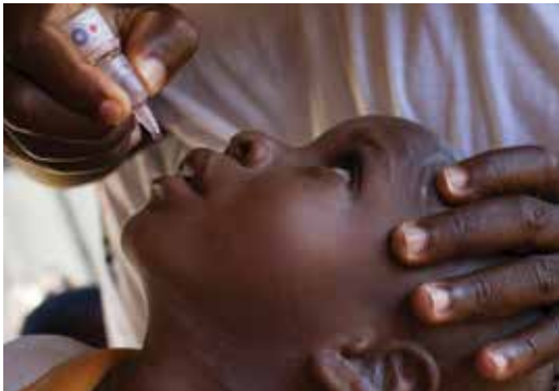
ナイジェリアでロータリアンが子どもにポリオの予防接種をする様子

ロータリー財団へのご寄付は、支援を必要とする地域社会に持続可能な変化をもたらすプロジェクトのために活用されます。財団への支援方法について詳しくは、クラブの財団委員長に尋ねるか、こちらのページをご覧ください。または、 ロータリー財団参照ガイド を参照するか、 ラーニングセンター の関連資料をご覧ください。