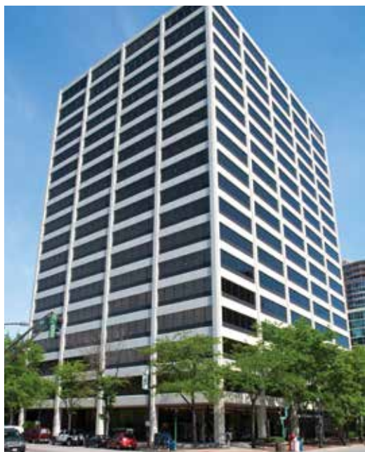
ワン・ロータリー・ センター（米国）

国際ロータリーは事務局によって管理運営が行われており、事務総長をはじめとする約800名のスタッフが世界中のクラブ・地区へのサポートを提供しています。世界本部は米国イリノイ州エバンストンにあります。この本部ビルは「ワン・ロータリー・センター」と呼ばれ、座席数190の講堂、資料室、RI理事会や管理委員会の会合が行われる会議室のほか、RI会長を含むシニアリーダーの部屋、さらには初のロータリークラブ例会が行われた711号室を復元した部屋もあります。また、東京を含む世界7カ所に国際事務局が置かれ、ロータリ